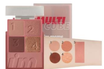
004 Glam Rose