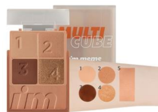
003 Baked Ginger