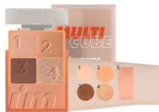
002 Hello Peach