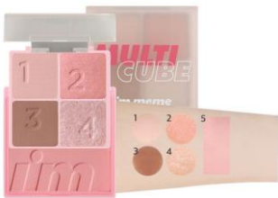
001 Sweet Pink