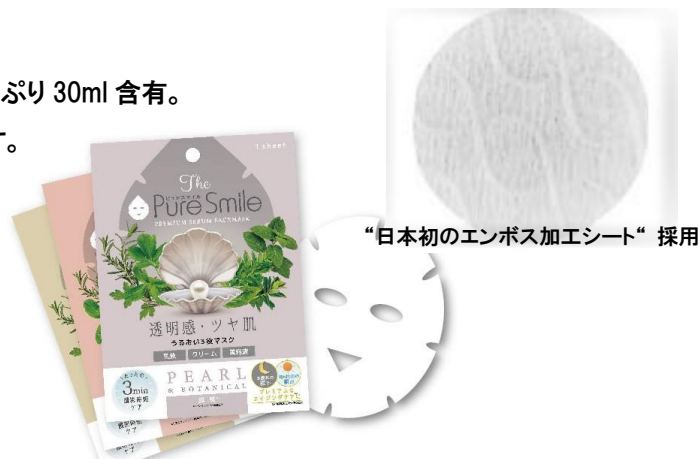
“日本初のエンボス加工シート”採用