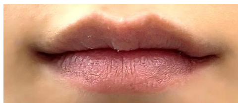
プランプカラーリップ使用前