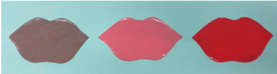
アメリカンチェリーの香り

リップケアの時間をもっと楽しんでいただけるように、今回のコラボでは、ベティーちゃんが生まれたアメリカのスイーツを感じさせる香りとおしゃれなカラーで商品開発しました。