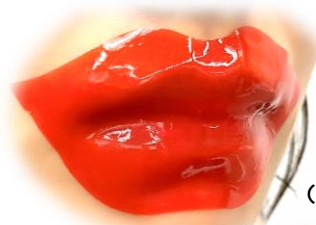
『うるりんリップパック』 (使用:アップルパイの香り)