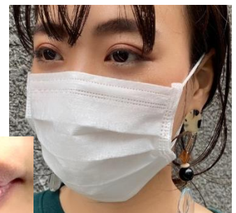
マスクによるくちびる荒れ

ここ数ヶ月に亘り、ウイルス対策でマスクを付ける時間が長くなっています。マスク装着中は、呼吸のたびに水蒸気がこもり、くちびるから本来のうるおいが奪われやすくなります。くちびるの保湿性を高めるために、夜は『うるりんリップパック』でケアをして、デイトタイムは『プンプカラーリップ』でくちびるの保護とリップメイクをするのはいかがでしょうか。『うるりんリップパック』は、リップ型のハイドロゲルが密着して、荒れやすいくちびるの角層へ保湿成分を浸透させます。『プンプカラーリップ』は、プンプ効果でくちびるをふっくらさせるほか、美容液成分でうるおいを与えて、さらにグロス効果とカラーでメイクアップにも使えます。