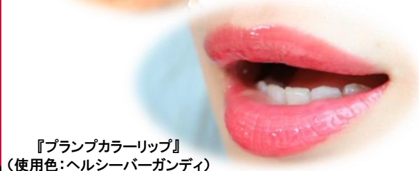
『プンプカラーリップ』 (使用色:ヘルシーバーガンディ)

ここ数ヶ月に亘り、ウイルス対策でマスクを付ける時間が長くなっています。マスク装着中は、呼吸のたびに水蒸気がこもり、くちびるから本来のうるおいが奪われやすくなります。くちびるの保湿性を高めるために、夜は『うるりんリップパック』でケアをして、デイトタイムは『プンプカラーリップ』でくちびるの保護とリップメイクをするのはいかがでしょうか。『うるりんリップパック』は、リップ型のハイドロゲルが密着して、荒れやすいくちびるの角層へ保湿成分を浸透させます。『プンプカラーリップ』は、プンプ効果でくちびるをふっくらさせるほか、美容液成分でうるおいを与えて、さらにグロス効果とカラーでメイクアップにも使えます。