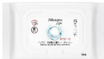
大容量 80 枚入り