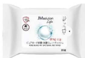
携帯用 20 枚入り

カチッと閉まって水分が乾燥しにくい、フタ付きの大容量 80 枚入りと、どこにでも携帯できる 20 枚入り、2 つのサイズからお選びください。