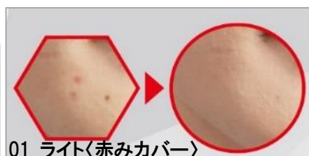
01 ライト〈赤みカバー〉