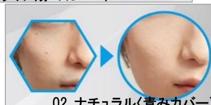
02 ナチュラル〈青みカバー〉