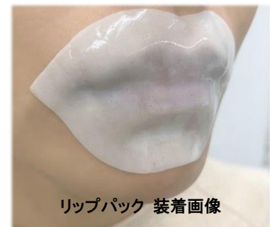
リップパック 装着画像 ハイドロゲルが密着して くちびるを保湿します

気分に合わせて香りを選んで、自分が使うだけでなく、お好みでいくつかを そろえて、ご家族やご友人への小さな贈り物にするのもオススメです。