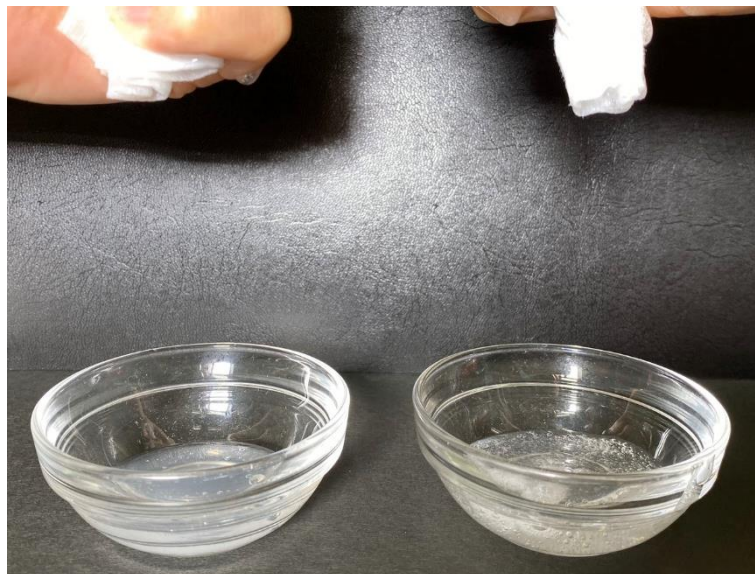
当社従来品のシート (美容液 23ml含有のタイプ)

『The Pure Smile プレミアムセラムマスク』に採用している「エンボス加工シート」の表面は、美容液を吸収しやすい凹凸構造です。当社従来品のシートマスクと比較しても、その差約 1.3 倍、1枚のシートに 30ml もの美容液を含んでいます。